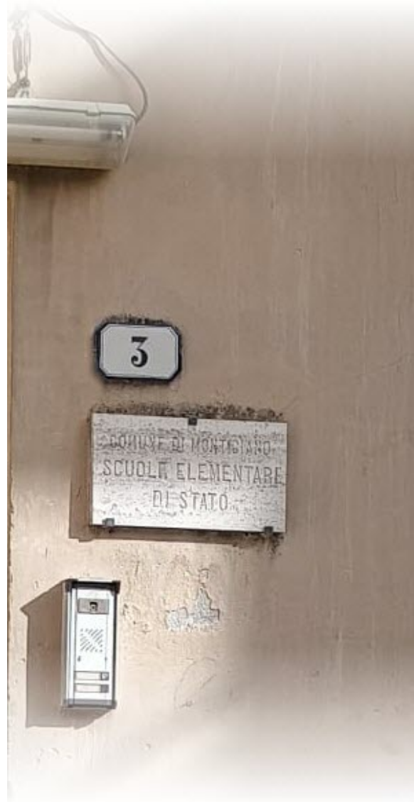
l'ingresso dal resede di via Barazzuoli

Sono trascorsi 4 anni dalla stipula del contratto con il comune e la cooperativa Montemaggio si rende conto di aver buttato nella spazzatura , per lavori eseguiti ma sopravvalutati, circa 430'000€ e la cosa non finisce qui perché, di lì a qualche anno, nell'ambito del processo di liquidazione, la cooperativa rinuncerà a procedere al rogito e dunque la cooperativa avrà compiuto gratis lavori per 880'000€.