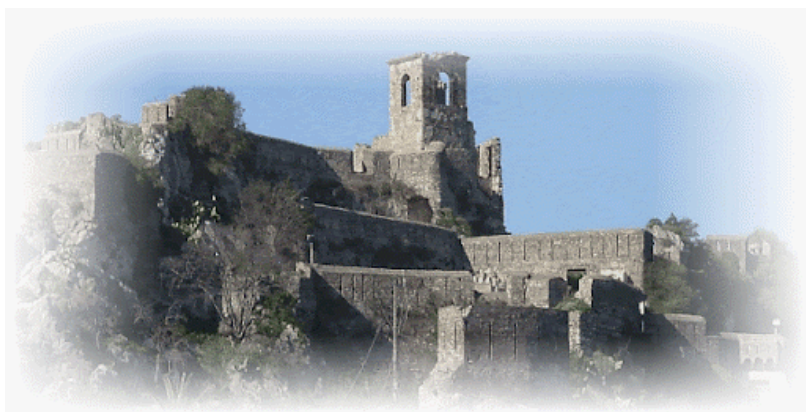
il castello normanno di Forza d'Agrò