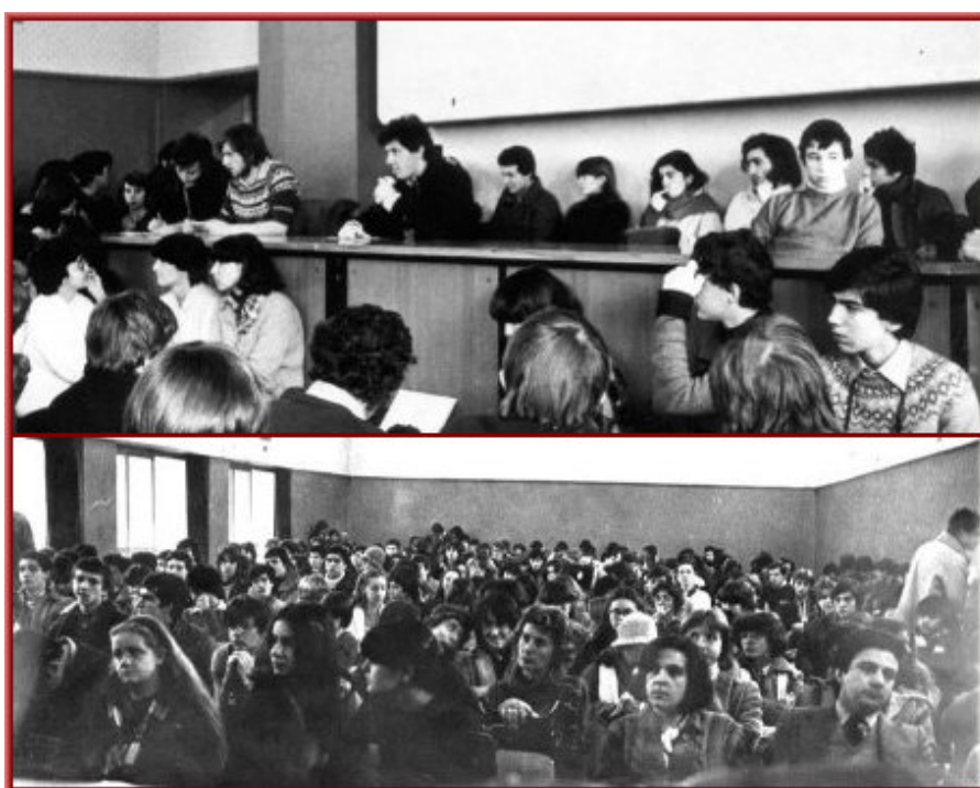
immagini di una assemblea durante la autogestione del 78

Ero supplente ma, per via dei trascorsi, non ero di quelli che si nascondono nel sottoscala , e dunque già al secondo Collegio iniziai ad intervenire.